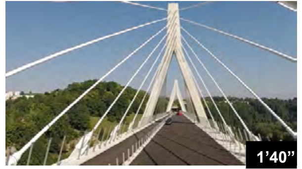
Etanchéité des joints de bordure sur le Pont de la Poya