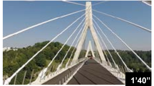
Etanchéité des joints de bordure sur le Pont de la Poya