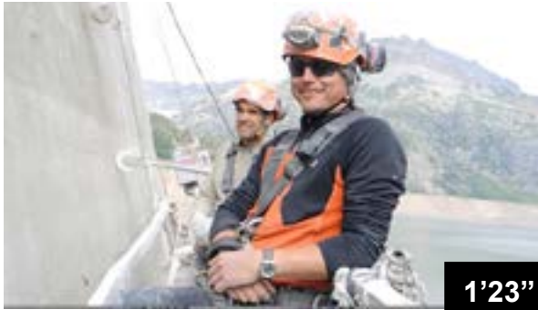
Traitement des joints sciés dans le parement amont du barrage d'Emosson