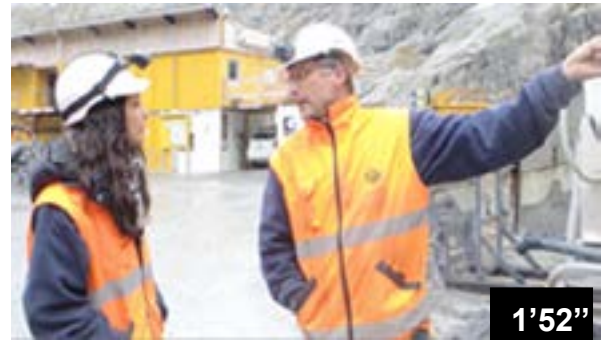
Joint de dilatation lors de la surélévation du barrage Vieux Emosson