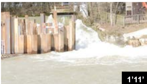
Construction d'une centrale hydro-électrique