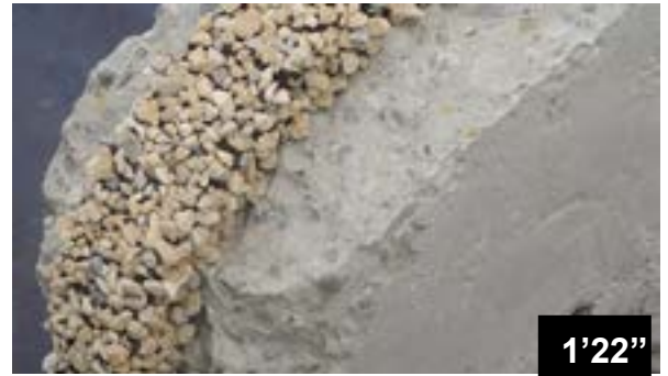
Collage des bandes BFL-Mastix sur une surface irrégulière