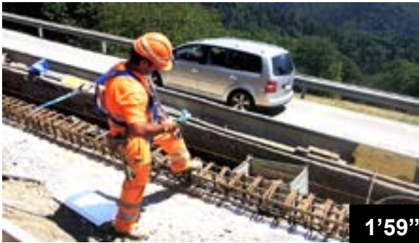
Surélévation d'un mur sur une route de montagne