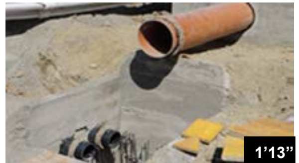
Collage des bandes BFL-Mas- tix sur des tuyaux en PVC