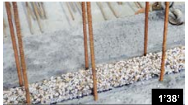
Collage horizontal des bandes BFL-Mastix type R