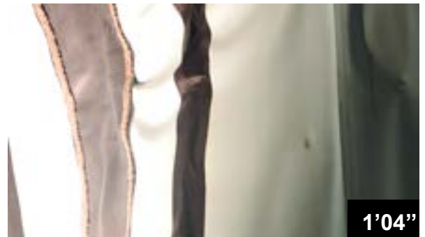
Etanchéité des joints dans le tunnel de Choindez