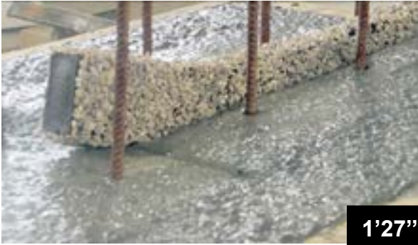
Pose des bandes BFL-Mastix type R4