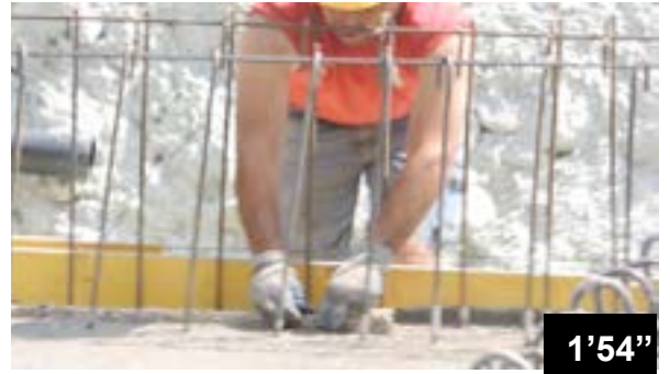
Incorporation des bandes BFL-Mastix 20/40 R4 dans le béton frais d'un ra- dier