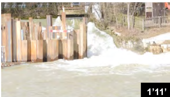
Bau einer hydro-elektrischen Kraftwerkzentrale