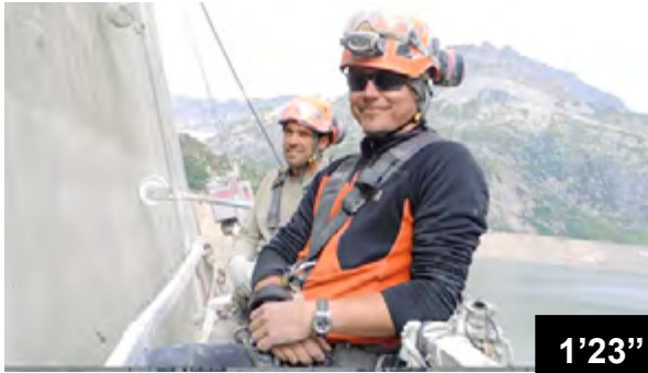
Behandlung von eingesägten Fugen an der Wasserseite der Staumauer Emosson