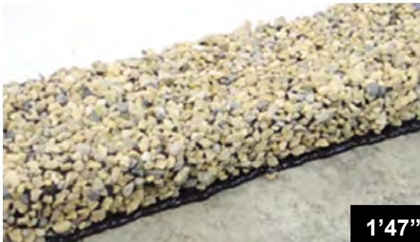
Klebung der BFL-Mastix Bänder auf Beton