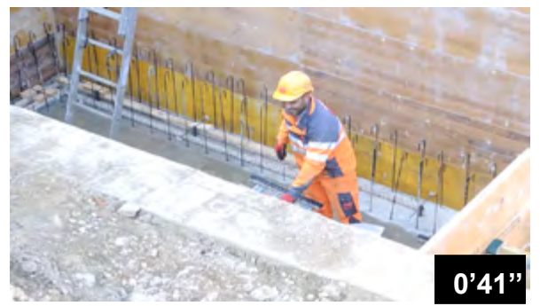
Fugendichtung mit sehr hohen Ansprüchen