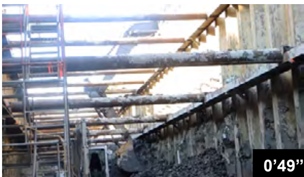
Fugendichtung am Absetzbecken Marc Aurèle Fortin