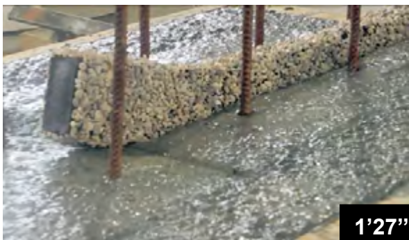
Verlegen der BFL-Mastix Bänder Typ R4