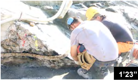
Klebung der BFL-Mastix Bänder auf Fels