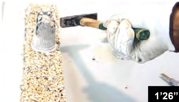
Haftung von frischem Beton