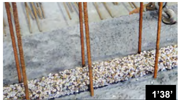
Horizontales Verkleben von BFL-Mastix Bändern Typ R