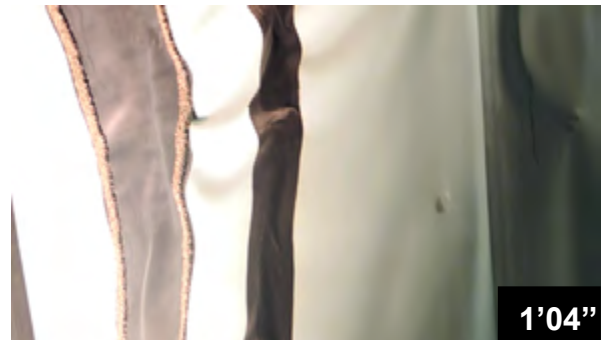
Fugendichtung im Tunnel de Choindéz