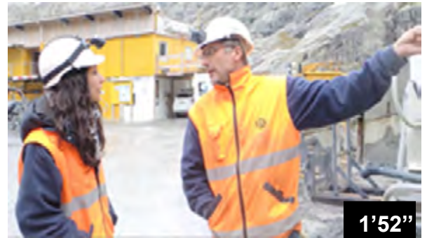
Dilatationsfuge bei der Überhöhung der Staumauer Vieux Emosson