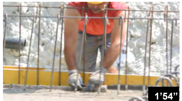
Einlegen von BFL-Mastix Bändern Typ 20/40 R4 in frischen Beton einer Bodenplatte