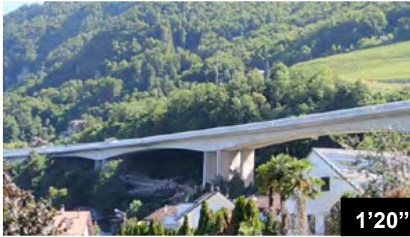
Absicherung von verankerten Fundamenten am Viadukt von Chillon