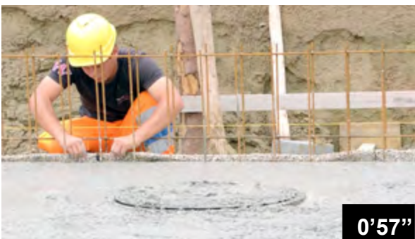
Einlegen von BFL-Mastix Bändern in frischen Beton einer Bodenplatte