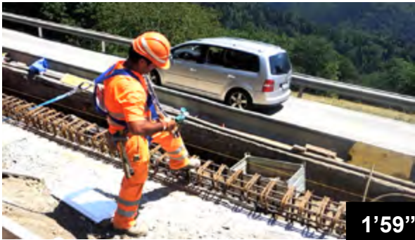
Erhöhung der Mauer einer Bergstrasse