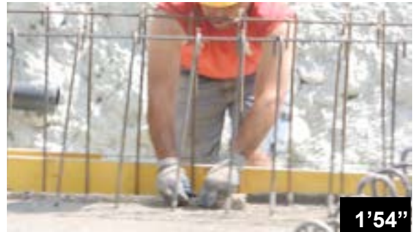
Einlegen von BFL-Mastix Bändern Typ 20/40 R4 in frischen Beton einer Bodenplatte