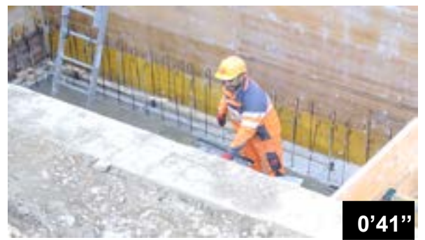
Fugendichtung mit sehr hohen Ansprüchen