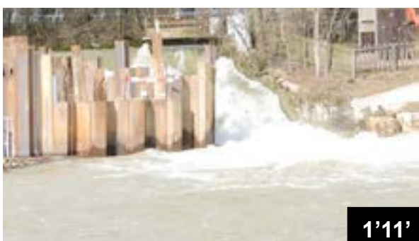
Bau einer hydro-elektrischen Kraftwerkzentrale