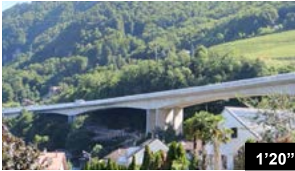
Absicherung von verankerten Fundamenten am Viadukt von Chillon