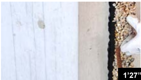
Vertikales Kleben der BFL-Mastix Bänder Typ R4 1/2 D