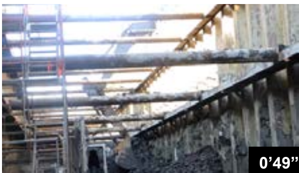
Fugendichtung am Absetzbecken Marc Aurèle Fortin