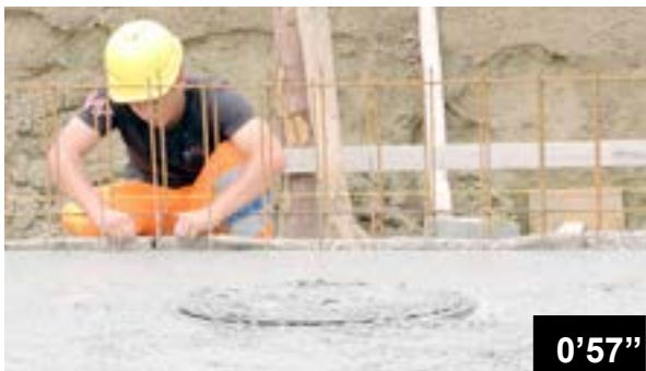
Einlegen von BFL-Mastix Bändern in frischen Beton einer Bodenplatte