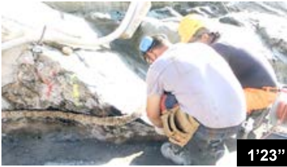
Klebung der BFL-Mastix Bänder auf Fels