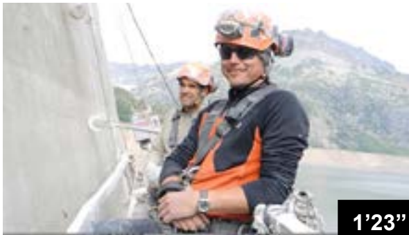
Behandlung von eingesägten Fugen an der Wasserseite der Staumauer Emosson