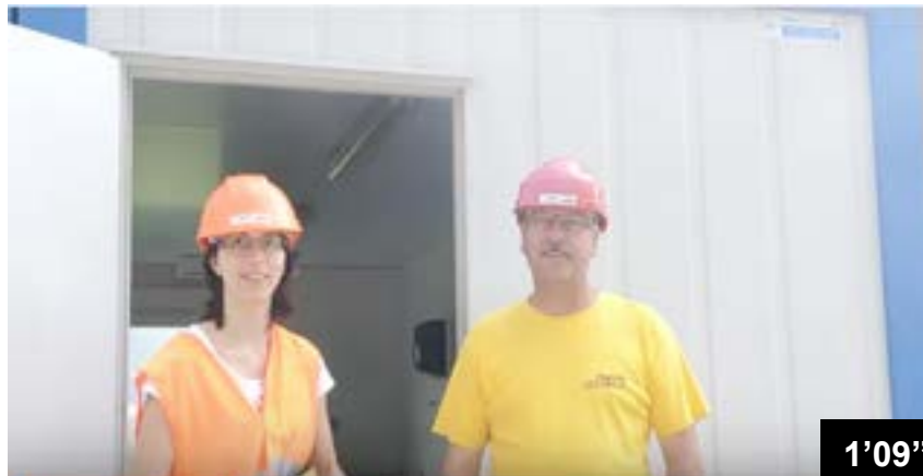
Verlegen der BFL-Mastix Bänder