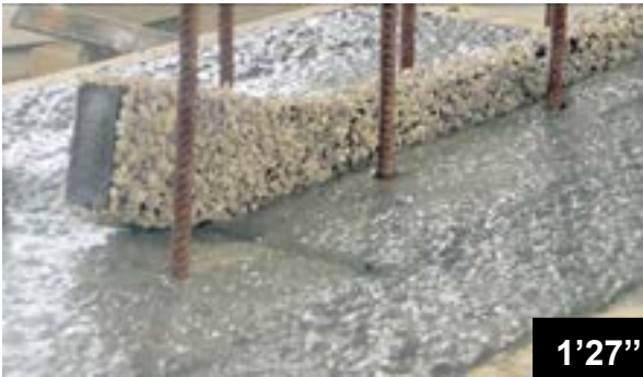
Verlegen der BFL-Mastix Bänder Typ R4