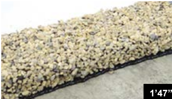
Klebung der BFL-Mastix Bänder auf Beton