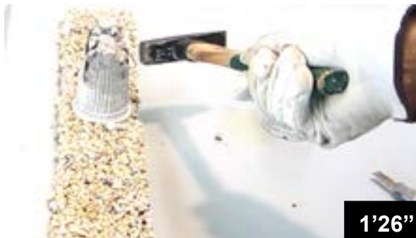
Haftung von frischem Beton